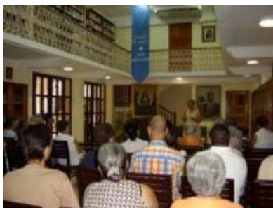
Parte del público asistente